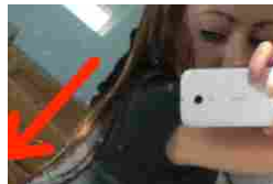
QUANDO IL SELFIE E' IMBARAZZANTE (FOTO)