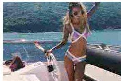
Opzioni Binarie: l'investimento giusto per avere rendite alte.