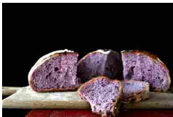
È arrivato il pane viola. Ecco perché fa bene