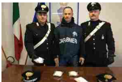
Giulianova, 100mila euro di cocaina in casa: due arresti